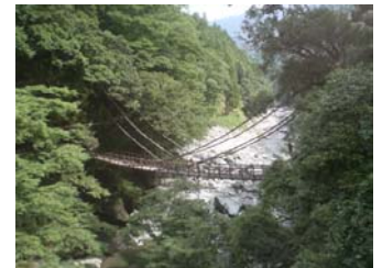
秘境“祖谷”かずら橋